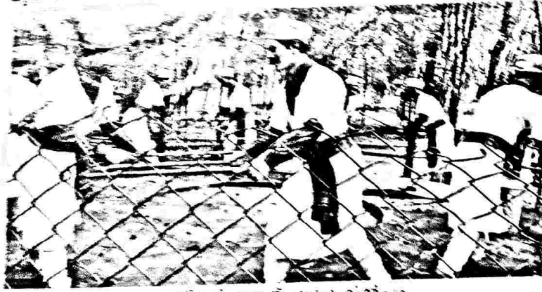
കൂടകംവെട്ടി തണൽ കല്പനയിൽ