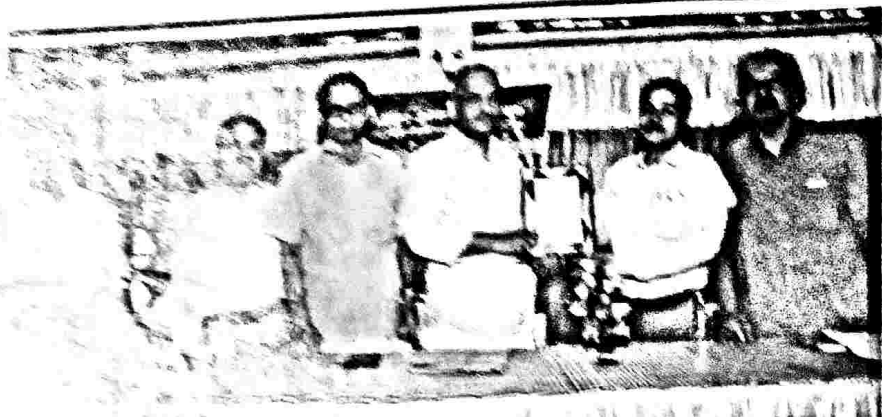
കോടതിയിൽ ഊതയിൽ ആദ്യമായി എ.എസ്.ഐ. റിപ്പോർട്ടർ വിജയ് ഓഫീസിലെ ആർ.ആർ.കെ. അംഗീകൃതം.