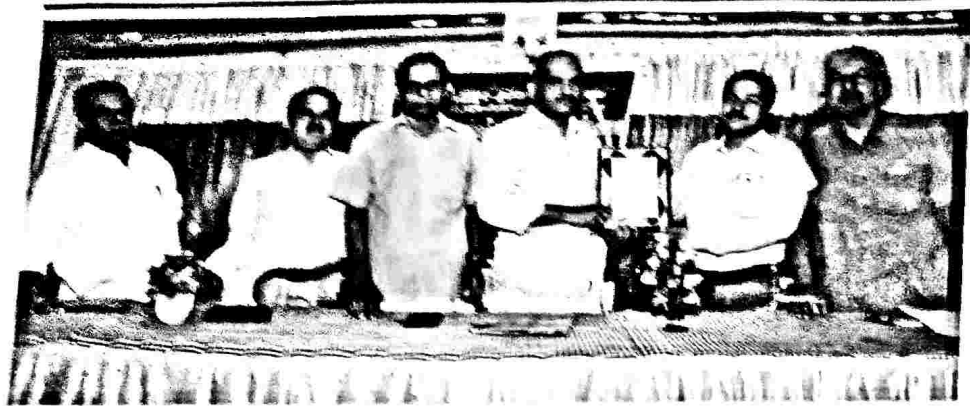
പുസ്തകസംഗ്രഹം കൈമാറുന്ന സമയത്ത് ഉദ്യോഗയിൽ അഭ്യമായി എ.എസ്.ഒ. സർട്ടിഫിക്കറ്റ് ലഭിച്ച കവനൂർ വില്ലേജ് ഓഫീസറെ ആർ.ആർ.കെ. ആദരിക്കുന്നു.