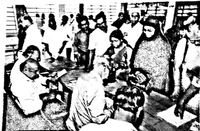
പുതുവത്സരാഘോഷ പരിപാടികളിൽ നിന്ന് -2018