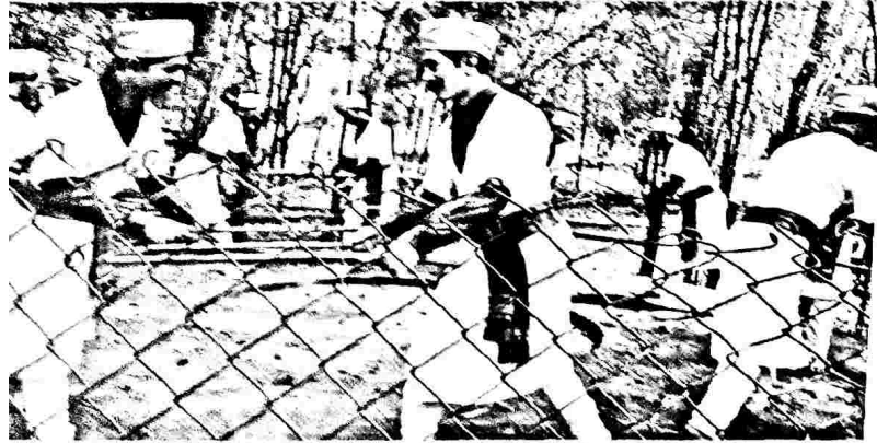
കൂടകിന്റെ തനത് കലാശിൽപം