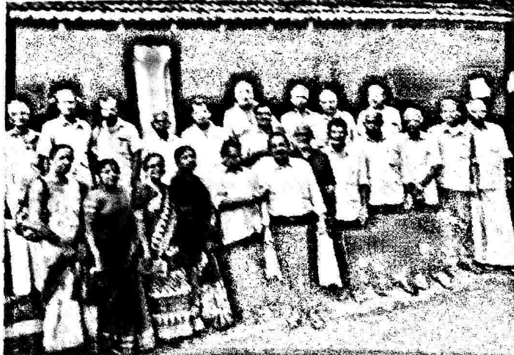
നിജന്യർ താലൂക്ക് ജനറൽ ബോഡി.